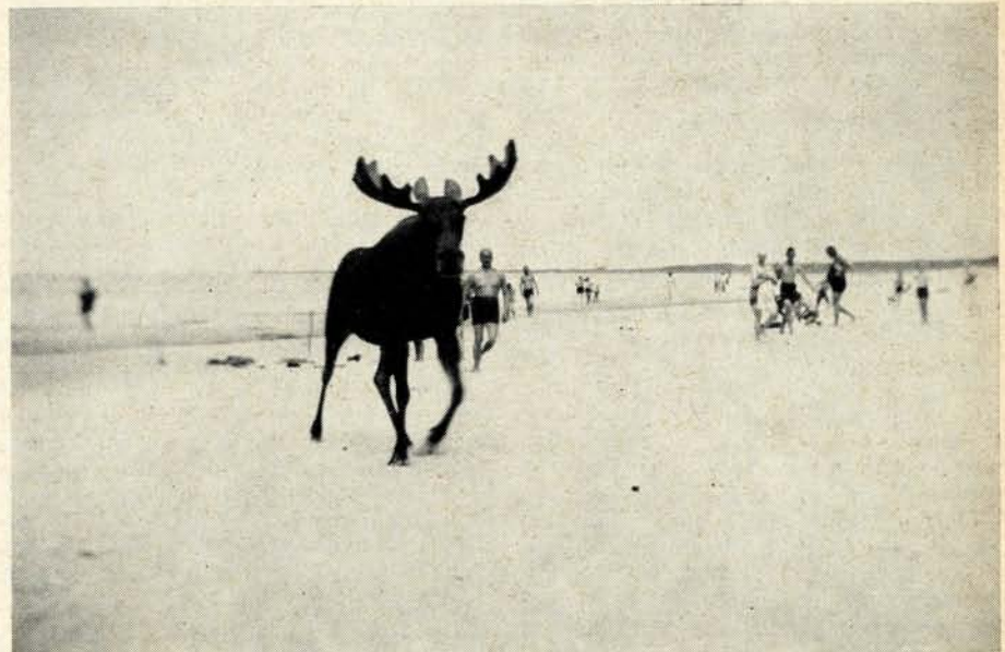
Der Sandkrug-Elch, wie er leibt und lebt

Weihnachten in der unendlichen Stille und Einsamkeit der Nehrung! Mit Erlaubnis des Försters zusammen mit dem Vater sich den allerschönsten Weihnachtsbaum im Wald selbst aussuchen dürfen. Schneeflockentanz Tag und Nacht, am nächsten Morgen alles wie verzaubert, der Wald noch stiller, noch lautloser geworden unter der weichen deckenden und dämpfenden Verhüllung. Geradezu feierlich wurde es da ums raue Bubenherz, als auch noch von der Stadt her der Klang der Kirchenglocken hinüberfand zum steinernen Haus in Zaborowskys Garten. Und dann hinausdürfen und die allerersten Fußstapfen in das unberührte Weiß setzen können! Das war schon was! Dompfaff und Meise, Specht und Amsel kamen bis ans Fenster und klopfen sogar an die Scheiben, wenn das Futter nicht schnell genug gestreut wurde. Eichkätzchen tummelten sich durch die Fliederbüsche auf der Suche nach den vertrockneten Samenkapseln. Besuch kam aus der Stadt und erzählte von eingezogenen französischen Soldaten, von denen man sich keine Vorstellung machen konnte, nur daß sie auch Kanonen und