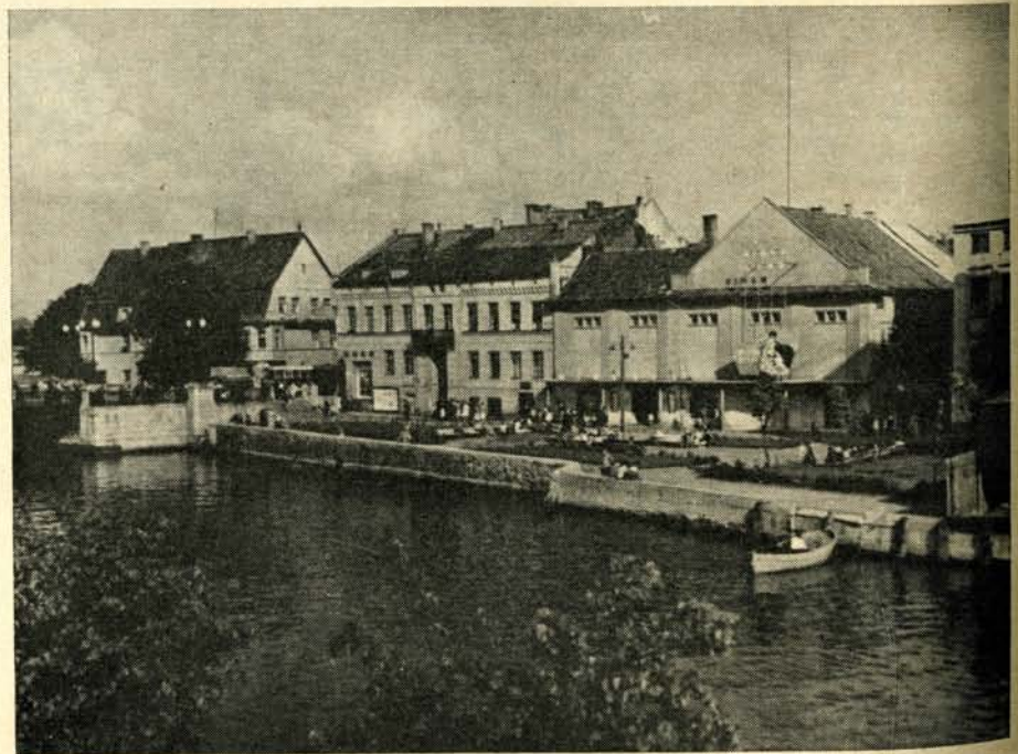
Heute – an der Börsenbrücke

Unsere Politiker sollten ernsthaft prüfen, ob nicht die Zeit gekommen ist, sich aus der Bevormundung durch die Sieger freizuschwimmen. Freilich, niemand kann aus seiner Haut. Und wer erst durch die Niederlage etwas in Deutschland geworden ist,