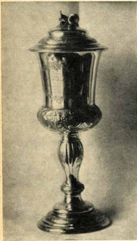
Das ist der Prökulser Abendmahlskelch aus dem Jahre 1854

In einem Kommentar unter der Überschrift „Wem gehört der Abendmahlskelch“ stellten wir schon damals die Frage, ob je-