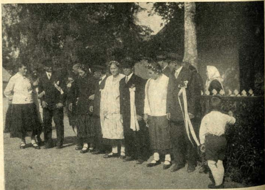
Fischerhochzeit auf der Nehrung

Eben erst treten wir heraus aus dem Bereich schier undurchdringlichen Kiefernkuselsaumes auf das weite Vordünen Gelände, das sich von der Südermole bis zum Sand-