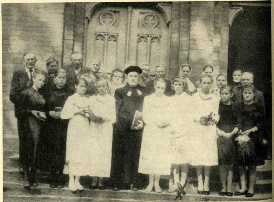
Memelländische Konfirmation in Saugen